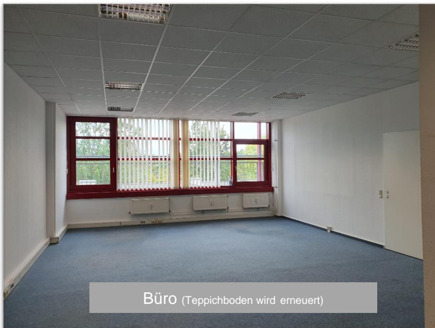
Büro (Teppichboden wird erneuert)