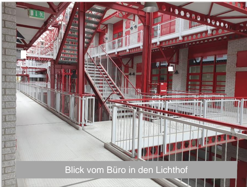
Blick vom Büro in den Lichthof